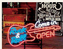
▲オリジナルデザインのネオン

そこでマスターは「もっと多くのお客さんに来てもらえるように、自分の趣味を生かして他店と差別化できないかな？」と考え、音楽をコンセプトとしたカフェへ生まれ変わることを決意し、商工会に相談。持続化補助金を活用することで店内にライブステージや本格的な音楽機材、スポットライトを設置し、ミュージックカフェに大変身しました。