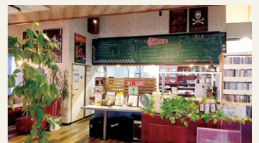
▲席同士の間隔を広めにとり過ごしやすい にこだわっています

ム。ノーチャージでリーズナブルにお酒を楽しむことができます。スタンダードなお酒からオリジナルカクテルまで取り揃えており、特別なひとときを過ごせます。