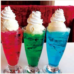
▲バリエーション豊かな クリームソーダ