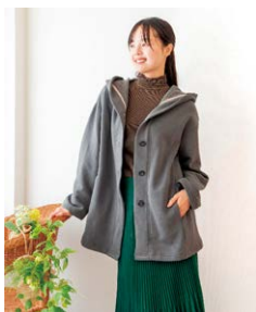
自社ブランド商品

具体的な商品としては、オーガニックコットンや裏起毛を使用した「ナッピング裏毛フード付きコーディガン」や、洗える柔らかマッシュマロ素材の草木染めの「七分袖Uネックインナー」、「タートルネックイン