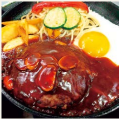
▲こだわりのお肉とトロトロ 卵のハンバーグ

「からあげ定食」「やきそば」「ナポリタン」「タコライス」等、和洋豊富なメニューを取り揃えています。また、定番メニューに加えて月替わりのメニューも用意しており、飽きのこない料理を提供しています。 「バータイム」 土曜日夜だけのスペシャルタイム