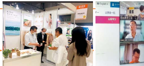
メッセナゴヤでの出展